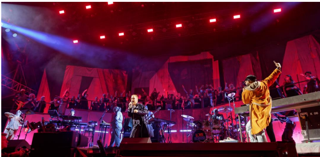
Der Auftritt beim NDR 2 Plaza Festival bildete gleichzeitig den Abschluss der „Love Songs“-Tournee von Peter Fox

Wedemark/Hannover, 30. November 2023 – Rund 20.000 Musikbegeisterte feierten am 8. September 2023 beim NDR 2 Plaza Festival die Live-Party des Jahres. Headliner der Open-Air-Veranstaltung in Hannover war Peter Fox, der mit einer extrem tanzbaren Mischung aus Dancehall, HipHop, Afro Beat und R'n'B die Massen elektrisierte. Dass sich die Stimme des Sängers trotz des druckvollen High-Energy-Sounds seiner Band stets mühelos durchsetzen konnte und auch die Song-Texte bestens zu verstehen waren, lag neben dem Können der erfahrenen Ton-Crew vor allem an hochwertigen digitalen Drahtlossystemen der Sennheiser Digital 6000 Serie.